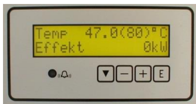
7-trinns elektronisk regulator med mulighet for fjernstyring

Kjelen leveres i effekter 35–150 kW i 230 V, 400 eller 690 V. Driftstemperatur er maks. 100 °C og driftstrykk maks. 6 bar. Kjelen er utstyrt med en elektronisk temperaturregulator med 7 trinn og temperaturområde fra 5 – 100 °C. Regulatoren har display for indikering av bl.a. temperatur, innkoblet effekt, antall innkoblede trinn osv.