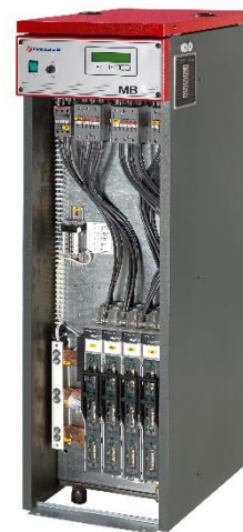
Bildet viser MB 150 kW/230 V

Regulatoren kan tilkobles uteføler for utetemperatur Kompensert varmekurve med justerbar helning og parallell forskyvning. Innebygget trinnbegrensningsfunksjon gjør at kjelen kan begrenses på mindre effekter.