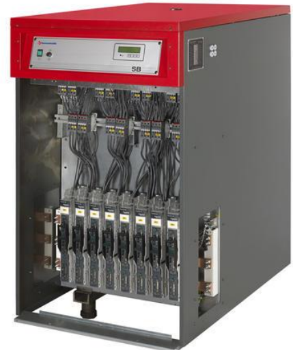
Bilde viser SB 600kW/400V

Regulatoren kan tilkobles uteføler for utetemperatur. Kompensert varmekurve med justerbar helning og parallell forskyvning. Innebygget trinnbegrensningsfunksjon gjør at kjelen kan begrenses på mindre effekter.