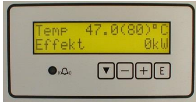
30-trinns elektronisk regulator med mulighet for fjernstyring

Kjelen leveres i effekter 375-400 kW i 230 V, og 375 – 600 kW for 400 hhv. 690 V. Driftstemperatur er maks. 100 °C og driftstrykk maks. 6 bar. Kan også leveres for 16 bar driftstrykk. Kjelen er utstyrt med en elektronisk temperaturregulator med 30 trinn og temperaturområde fra 5 – 100 °C. Regulatoren har display for indikering av bl.a. temperatur, innkoblet effekt, antall innkoblede trinn osv.